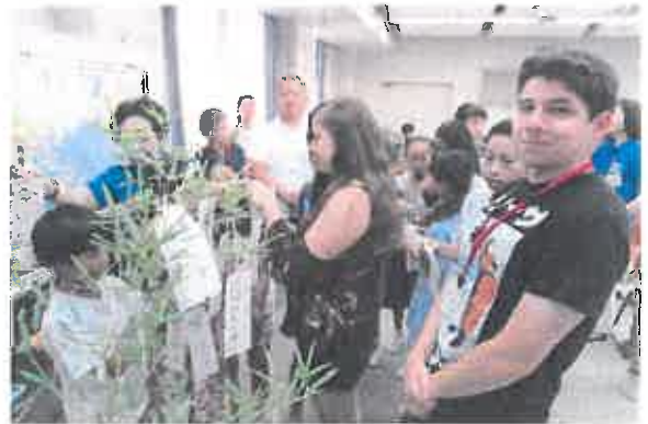
小学校訪問(朝日ヶ丘小)