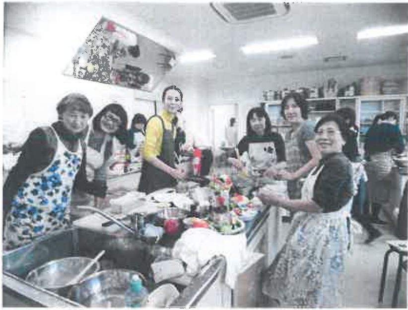
作ってたべよう世界の料理 「調理風景」