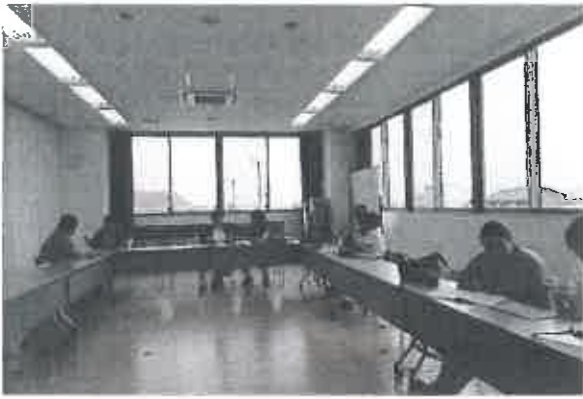
日本語教室（潮芦屋交流センター）↑