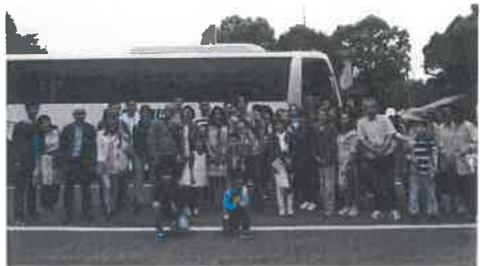
日本語教室バス旅行（淡路島）