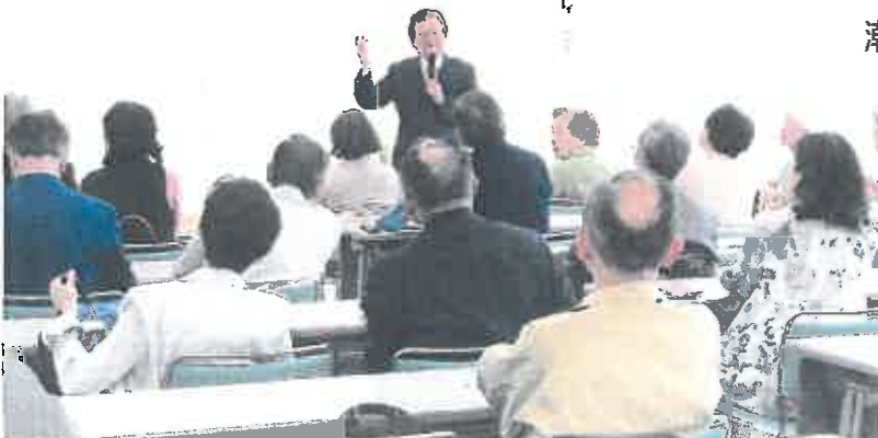
潮芦屋文学セミナー 「講演風景」