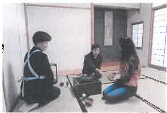
外国人のための文化教室 茶道↑