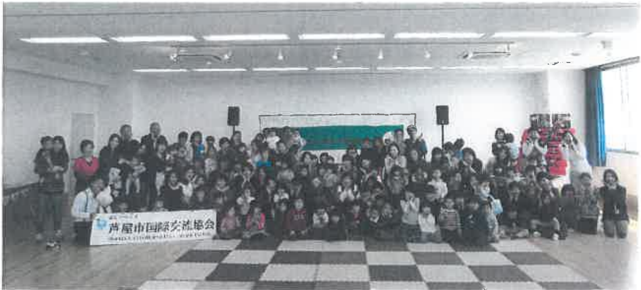
おやこふれあいコンサート