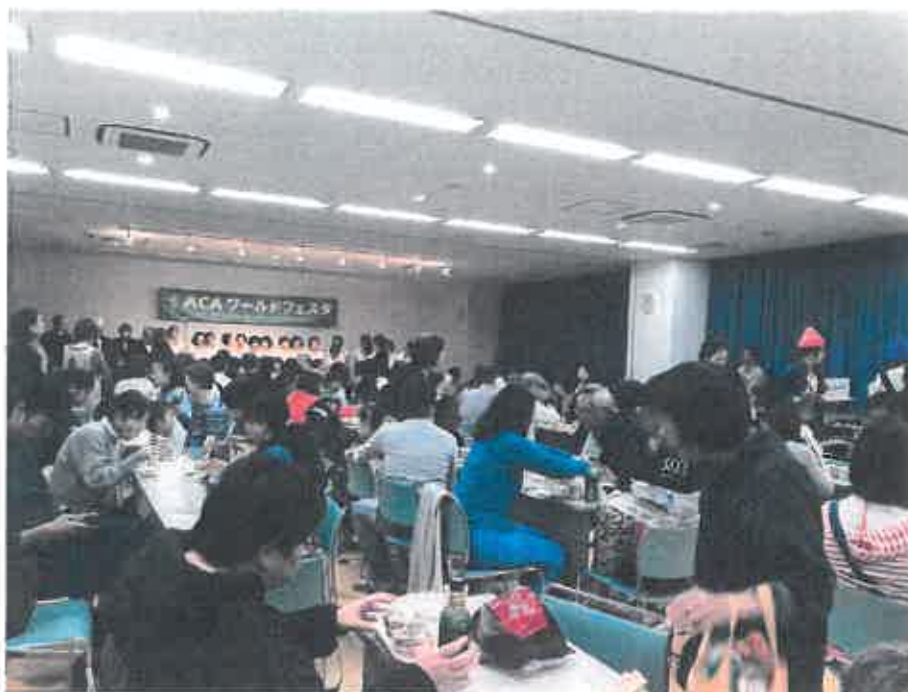
ワールドフェスタ 「世界の料理 食事風景」