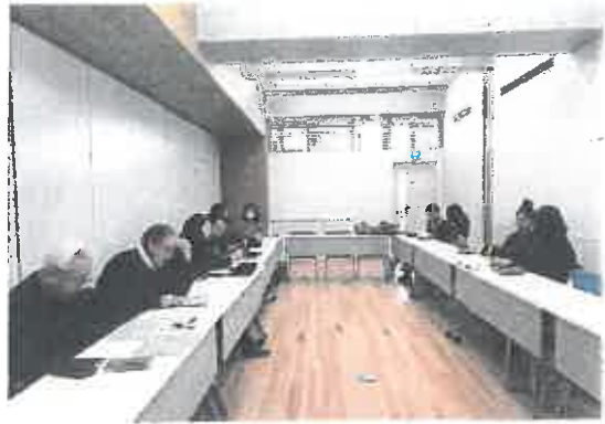
日本語教室（北教室）↑