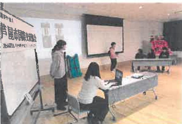
外国人のための防災教室（2月16日）↑