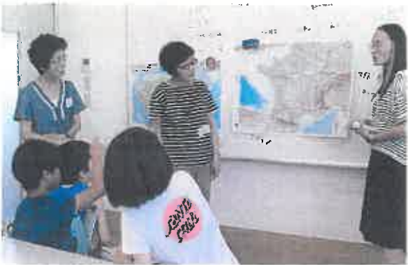
こどものためのにほんごきょうしつ↑