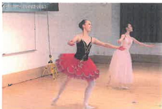
ワールドフェスタ 「コンサート」