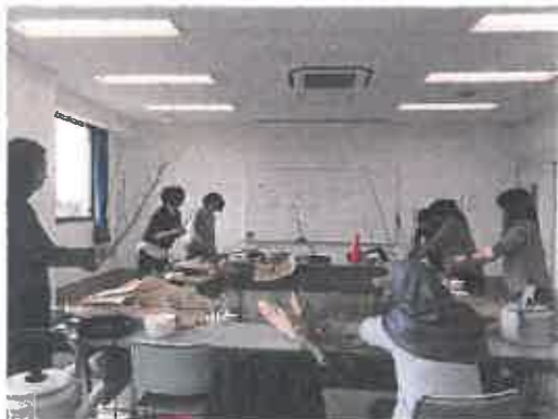
外国人のための文化教室 華道↑